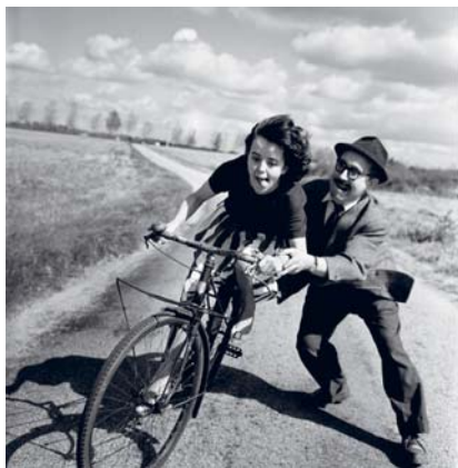
Robert Doisneau, 1960 ca.

restituiti dopo mezzo minuto”, si giustificò l'artista, ma l'accusa di maltrattamento infantile era ormai passata in giudicato 3 .