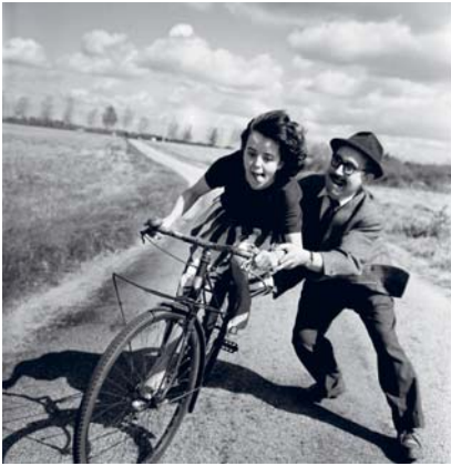
Robert Doisneau, 1960 ca.

restituiti dopo mezzo minuto”, si giustificò l'artista, ma l'accusa di maltrattamento infantile era ormai passata in giudicato 3 .