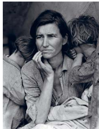
Dorothea Lange, 1936.

Diversamente, il reportage di Dorothea Lange nella California del 1936 era la documentazione del dramma degli abitanti dei piccoli paesini dell'ovest degli Stati Uniti. In missione come Field investigator and photographer nell'ambito di programmi del New Deal di Roosevelt, ebbe l'incarico di fotografare l'accampamento di contadini a Nipomo: “ I saw and approached the hungry and desperate mother, as if drawn by a magnet. I do not remember how I explained my presence or my camera to her, but I do remember she asked me no questions. I made five exposures, working closer and closer from the same direction. I did not ask her name or her history. She told me her age, that she was thirty-two. She said that they had been living on frozen vegetables from the surrounding fields, and birds that the children killed. She had just sold the tires from her car to buy food. There she sat in that lean-to tent with her children huddled around her, and seemed to know that my pictures might help her, and so she helped me. There was a sort of equality about it ” 4 . Cinque scatti: in modo casuale era nata l'immagine icona della Grande Depressione americana. Ma dall'esperienza della Lange era formalizzato anche un dubbio cruciale nella storia della fotografia contemporanea: “ The worse the work, the richer the material ”.