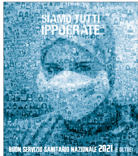
Collage fotografico di Auguri di Buon SSN 2021, composto da foto di parte dei 700 medici che sostengono l'iniziativa, provenienti da 12 regioni d'Italia.

Non abbiamo la pretesa di riformare l'Italia. Non è nostro compito. Ma desideriamo curare i nostri pazienti e per farlo abbiamo bisogno che lo Stato ci aiuti. Un saggio motto recita che "quando c'è la salute c'è tutto". Non aspettiamo di perdere quel "tutto". Non ci interessa differenziarci tra medici ospedalieri e universitari, medici di medicina generale e pediatri di libera scelta, dipendenti o libero-professionisti, pubblici o privati: abbandonando chi si fa