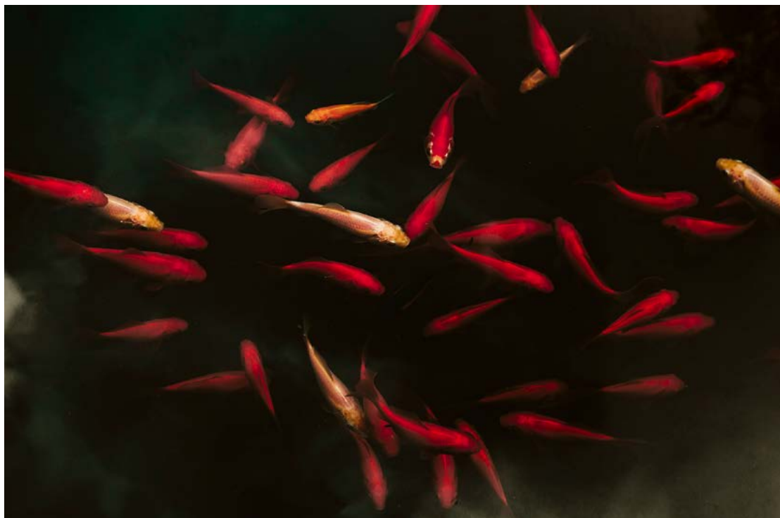
Piena di grazia, Pesci rossi, 2019