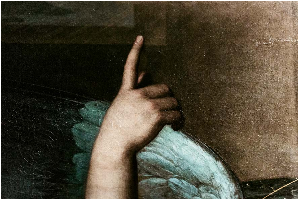
Piena di grazia (sx), dittico statue (dx), 2023

delle informazioni che acquisiamo nel corso della nostra vita – sia attivamente attraverso studi, ricerche professionali o semplici curiosità personali, sia passivamente – a volte le cose riemergono e sono loro a scegliere noi.