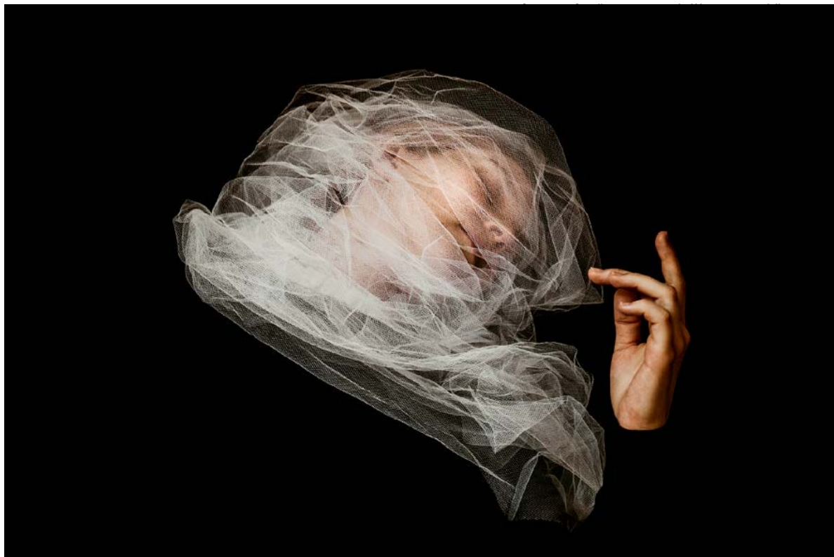
Piena di grazia, Donna velata, 2018

di prova per la luce, oppure in quei momenti in cui la persona di fronte a me crede di non essere fotografata. È proprio lì che secondo me la finzione sbiadisce per lasciare intravedere un senso di verità. In molte immagini affiorano gesti interrotti e “rubati”, movimenti appena accennati, sguardi assorti: dettagli minimi che aprono a un'altra dimensione, quella dell'interiorità.