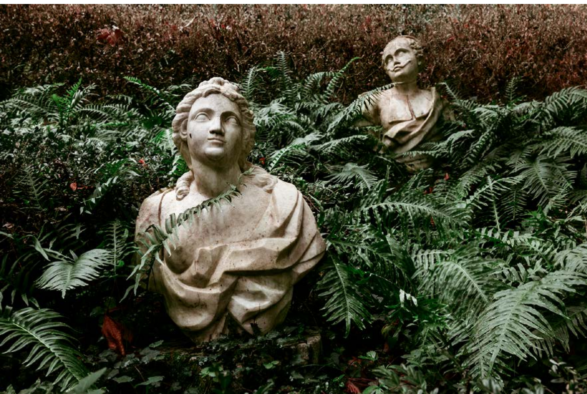
Piena di grazia, Labbra, 2023